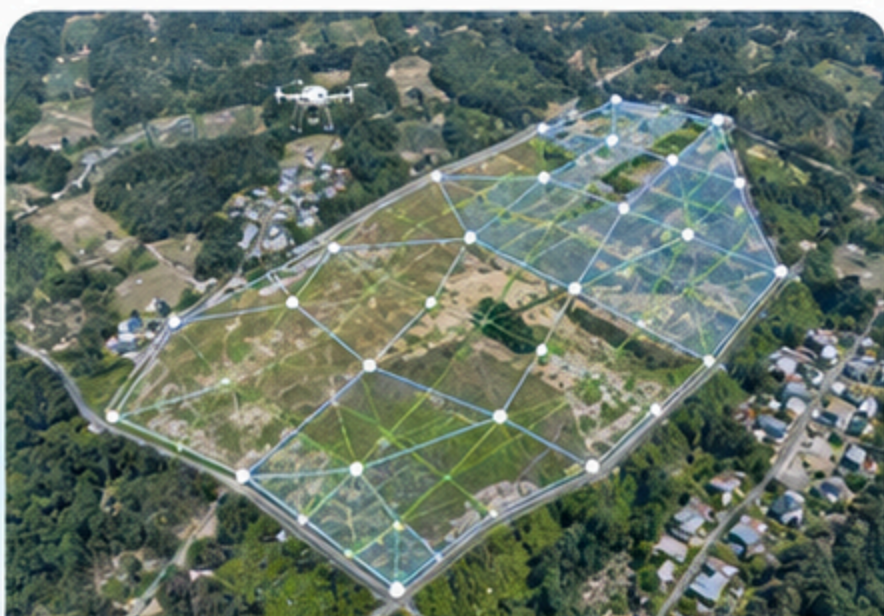
写真測量・写真計測