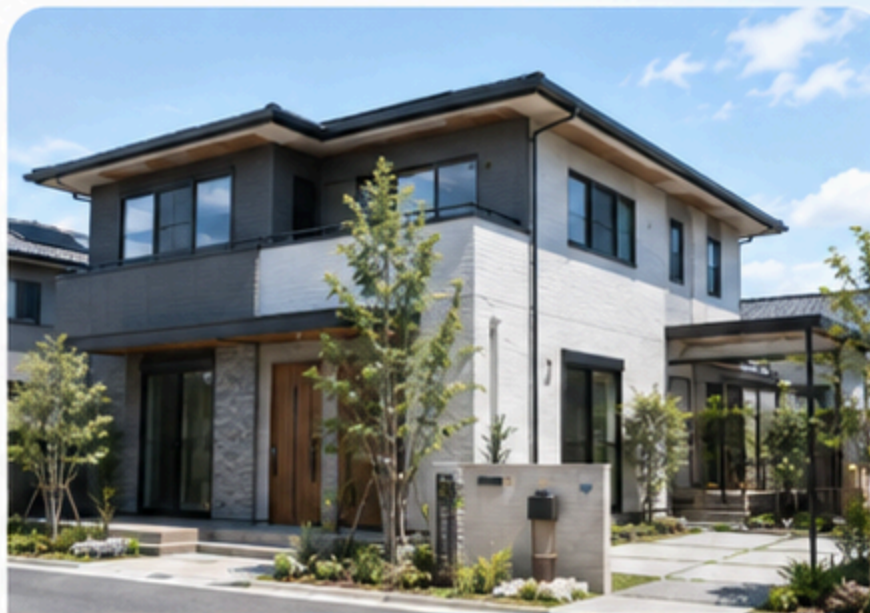
建築・不動産撮影