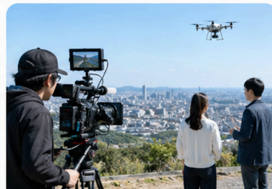
放送・ロケーション撮影