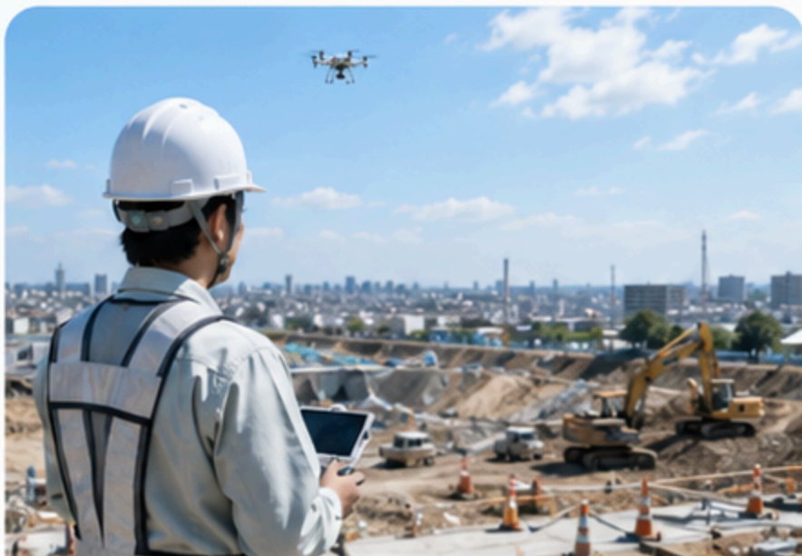
建設・土木の現場調査